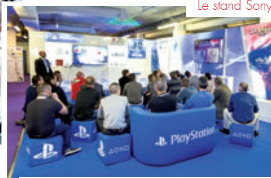
Le stand Sony