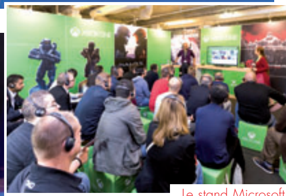
Le stand Microsoft