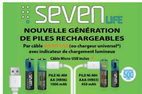
Piles rechargeables SEVENLIFE par câble micro-usb.