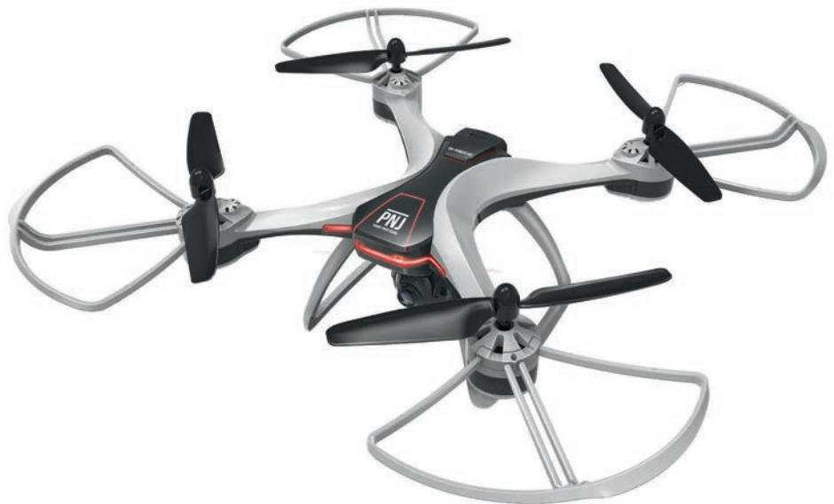
DR POWER HD : Le nouveau drone GPS de PNJ (179 euros).

Les dernières marques que nous avons intégrées récemment sont : Arozzi, Seven Life, Lenco, Braven, X-mini, Philips (rétro et vidéoprojecteurs), Braven et Sbox pour les supports écrans. Dans le détail, Arozzi, spécialiste du mobilier gaming, a un rapport qualité prix imbattable et nous avons la volonté de nous renforcer dans le secteur du gaming. Seven Life est notre marque de piles rechargeables en micro USB que nous