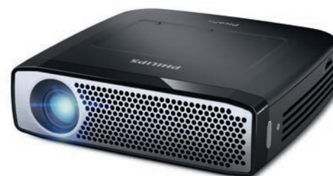
Rétroprojecteur PHILIPS NEOPIX (de 69 à 199 euros).

Le groupe Trax est devenu en quelques années un acteur incontournable sur le marché. Pour continuer à progresser, nous devons augmenter notre fonds de roulement pour financer nos stocks et notre croissance. C'est notre priorité en 2019. Pour cela, plusieurs possibilités s'offrent à nous. D'une part, en faisant entrée au capital un distributeur européen qui souhaiterait s'installer en France et se développer rapidement. Car quel que soit votre taille à l'étranger, il est difficile aujourd'hui de s'installer en France et d'espérer devenir un acteur important en quelques années. Nous sommes la cible idéale pour ce genre d'acteurs. Des discussions sont en cours avec l'un d'eux. Nous avons également la possibilité de nous associer avec un distributeur de notre taille, ayant des fonds propres plus importants, qui nous permettrait de doubler notre chiffre d'affaires en nous apportant le cash-flow nécessaire à notre développement. C'est également en négociation actuellement. Et enfin, nous pouvons également renforcer nos fonds propres en Equity ou des fonds mezzanine. Mais nous préférons les premières possibilités, car au-delà de l'aspect financier de l'opération, je suis convaincu que nous sommes plus forts à plusieurs, que seul, même avec des moyens renforcés. ■