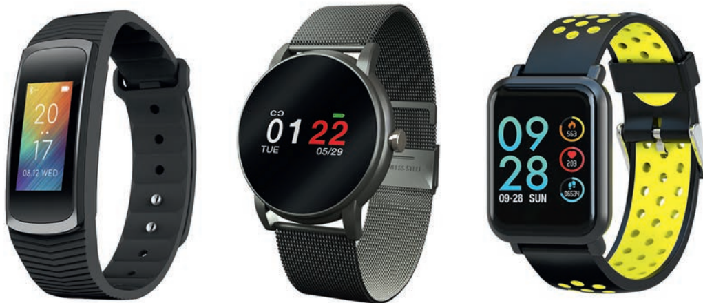
Les nouvelles ABYX FIT HR (39,90 euros), ABYX FIT PRO (49,90 euros) et ABYX FIT TOUCH (59,90 euros).

comme un promoteur de marques, nous sommes de vrais vendeurs. Nous ne sommes pas un « box moover » (pousseur de boîtes) et c'est pour cette raison, que vous trouverez peu de marques A dans notre catalogue. Ce travail demande une marge suffisante pour couvrir les frais engagés à l'implantation, mais également pour pouvoir réaliser la promotion de marques peu ou inconnues en France à grande échelle. C'est la clé de notre succès sur le marché.